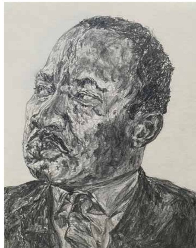
Martin Luther King

Ses œuvres vibrent d'un foisonnement d'idées, d'une richesse de textures et d'une authenticité brute qui ne laisse jamais indifférent : un artiste à la croisée des chemins où le passé se fond dans l'instant et où chaque toile est un espace de liberté absolue.