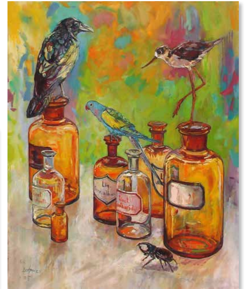
Contes d'apothicaire, huile sur toile, 100x80 cm

La couleur est son premier langage. Il pose les teintes avant même de définir la forme, construisant la composition à travers un équilibre fragile entre harmonie et dysharmonie. Parfois, il « recycle » ses propres œuvres, superposant couches et souvenirs, créant des toiles imprégnées d'un passé qui transparait sous les nouvelles lignes. Chaque tableau devient un champ de bataille entre précision et spontanéité, réalisme et mystère.