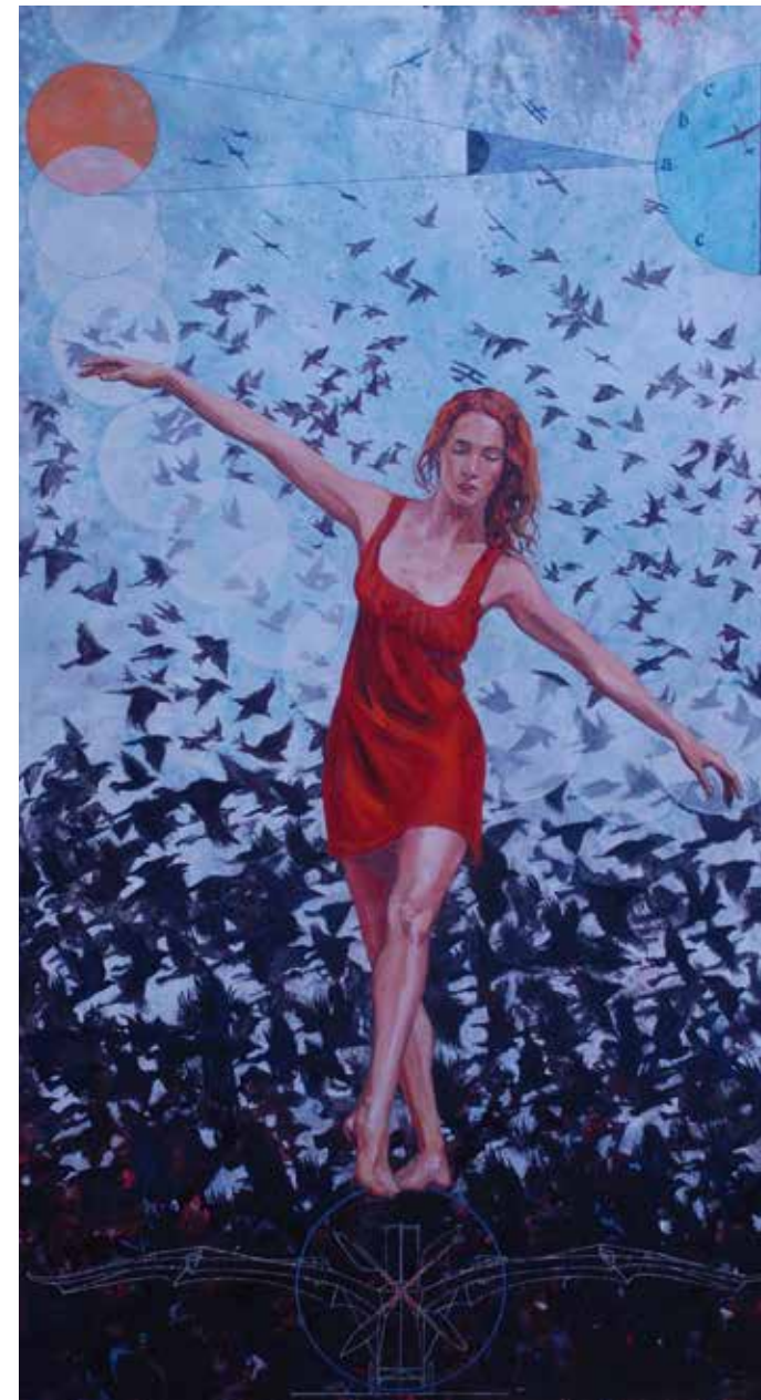
LA FILLE D'ICARE, huile sur toile, 270x150 cm

Diplômé en Arts Plastiques à l'Université des Sciences Humaines de Strasbourg, il se heurte à l'enseignement académique où plane encore l'ombre de Matisse et de Picasso. Son premier véritable choc pictural vient d'Allemagne avec les Nouveaux Fauves. Là, il découvre une peinture viscérale, rapide, vibrante, qui fait écho à son propre appétit d'images. Dès lors, son travail évolue : la rage brute des débuts laisse place à une recherche plus complexe, une quête de tension entre abstraction et figuration.