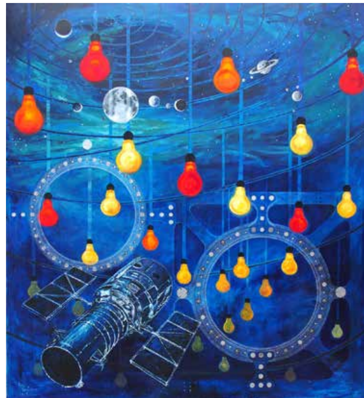
INDUSTRIAL BROOKLYN, Huile sur toile, 158x250 cm