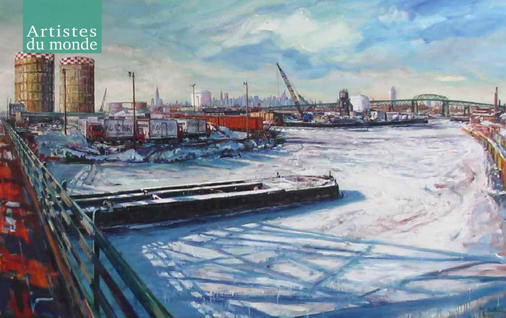
INDUSTRIAL BROOKLYN, Huile sur toile, 158x250 cm