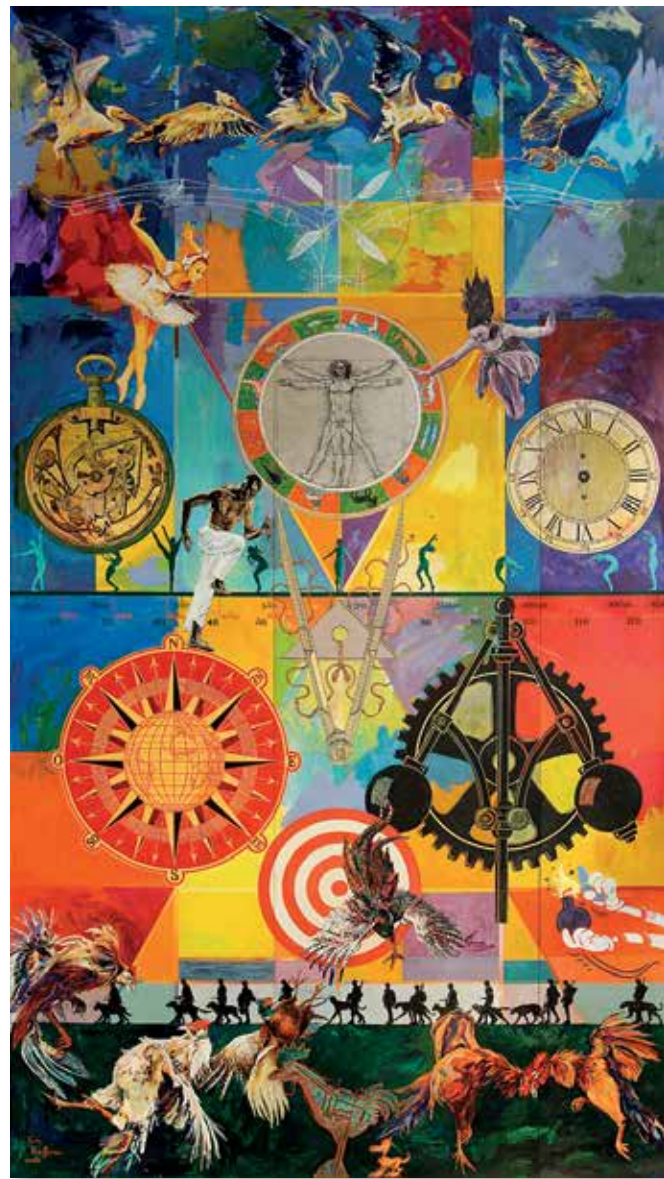
Les cercles vicieux, acrylique et encre sur bois, 700x386 cm

Ses œuvres vibrent d'un foisonnement d'idées, d'une richesse de textures et d'une authenticité brute qui ne laisse jamais indifférent : un artiste à la croisée des chemins où le passé se fond dans l'instant et où chaque toile est un espace de liberté absolue.