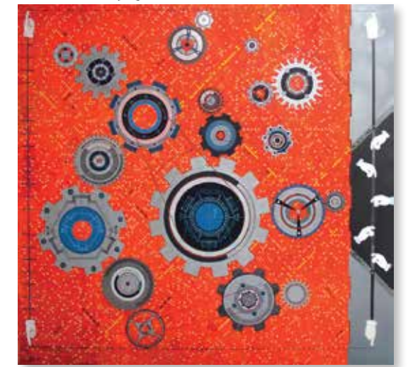
Entre science et fiction I, acrylique et encre sur bois et métal, 289x301 cm