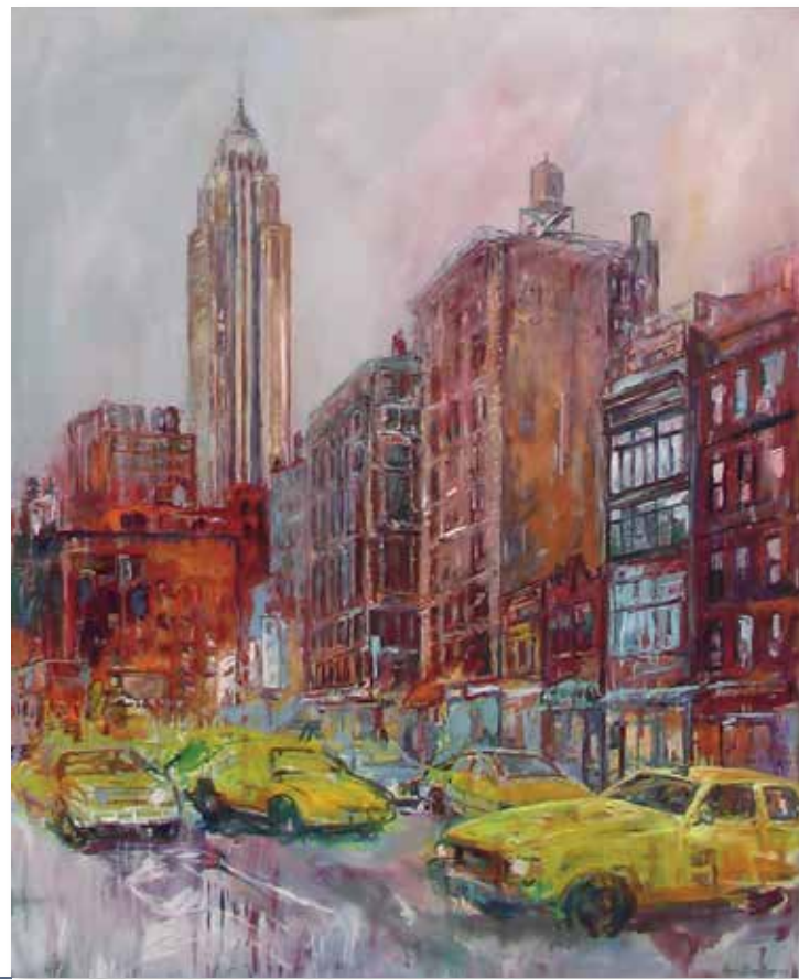
Yellowcabs in the blizzard, huile sur toile, 151x122cm